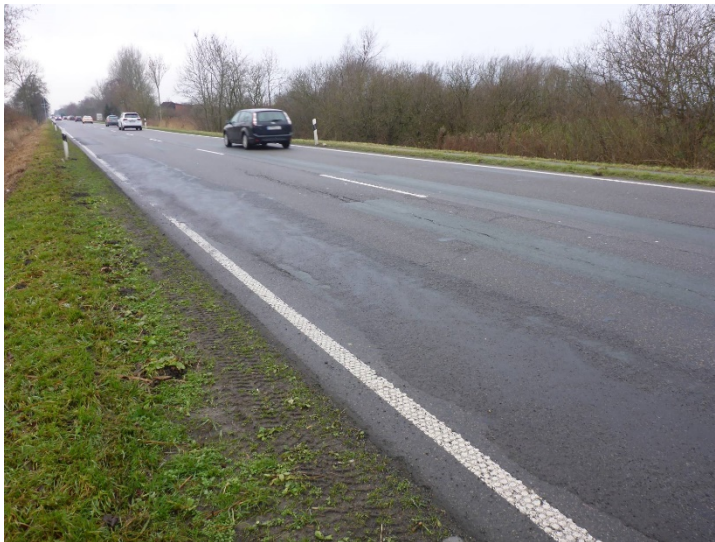
Bild 1: Verformungen, Risse und „Ausgleichsschichten“ bzw. Flickstellen

Straßenbau im Bestand auf Klei und Torf im Untergrund – aktueller Zustand und noch nicht kalibrierte Impulsradarergebnisse